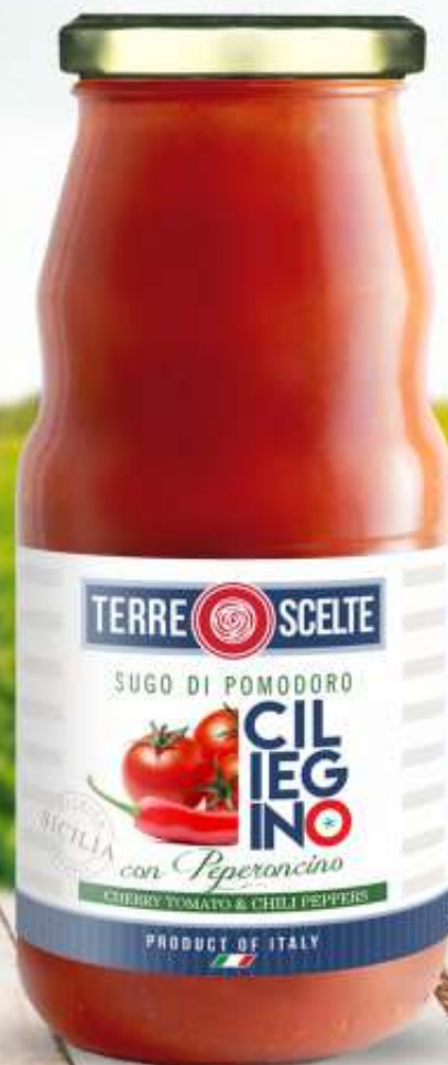
SUGO DI POMODORO CILIEGINO CON PEPERONCINO CHERRY TOMATO SAUCE WITH CHILI PEPPERS SAUCE AUS KIRSCHTOMATEN MIT CHILI