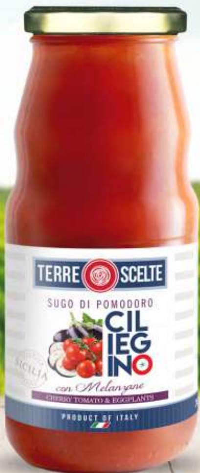
SUGO DI POMODORO CILIEGINO CON MELANZANE CHERRY TOMATO SAUCE WITH EGGPLANTS SAUCE AUS KIRSCHTOMATEN MIT AUBERGINEN